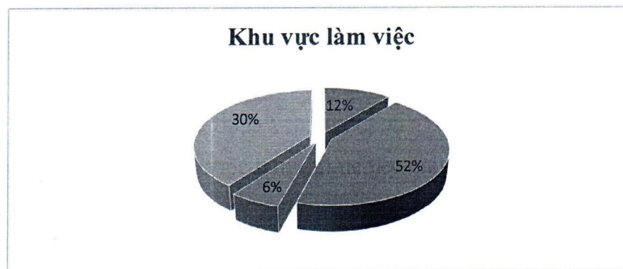
Biểu đồ 3. Khu vực việc làm của cựu sinh viên sau 12 tháng tốt nghiệp

Khảo sát khu vực việc làm của sinh viên DNTU sau khi tốt nghiệp như sau: