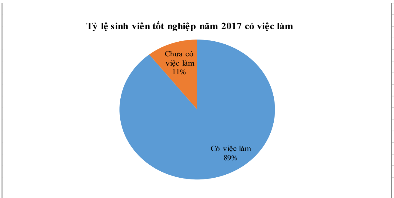
Biểu đồ 1. Tỷ lệ việc làm của cựu sinh viên DNTU năm 2017

Trong đó phân bố tỷ lệ sinh viên có việc làm sau một năm tốt nghiệp theo nhóm ngành như sau: